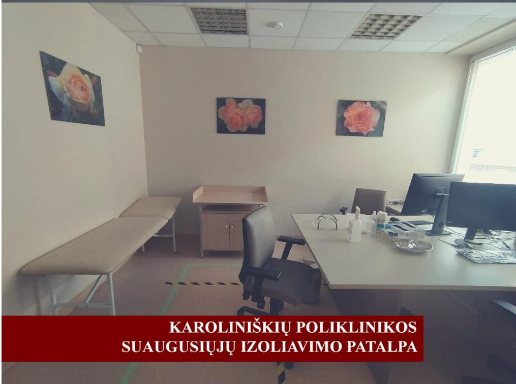
KAROLINIŠKIŲ POLIKLINIKOS SUAUGUSIŲJŲ IZOLIAVIMO PATALPA