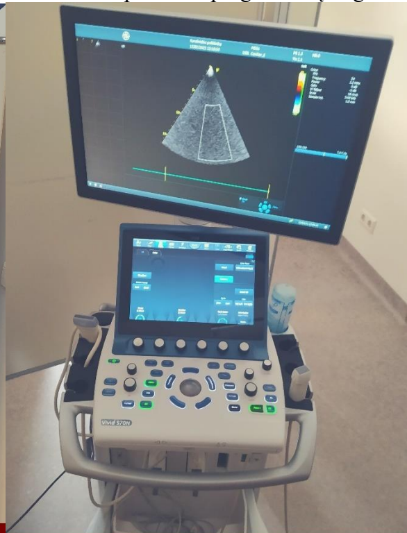
KONSULTACIJŲ SKYRIAUS ULTRAGARSINĖ DIAGNOSTINĖ ĮRANGA KARDIOLOGINIAMS TYRIMAMS

2020 m. parengtos trys naujos tvarkos siekiant gerinti skaidrumo bei atskaitomybės veikloms: