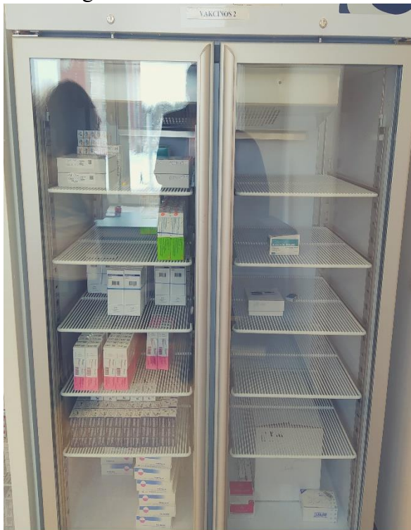
KLINIKINĖS DIAGNOSTIKOS LABORATORIJOS ŠALDYTUVAS VAKCINŲ LAIKYMUI

Registratūra: bekontaktės termovizinės kameros komplektu su programine įranga.