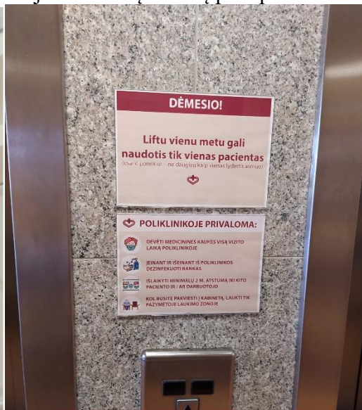
SKELBIAMOS AKTUALIOS INFORMACIJOS PACIENTAMS PAVYZDYS