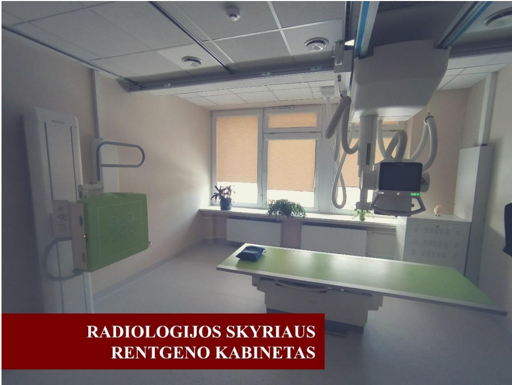
RADIOLOGIJOS SKYRIAUS RENTGENO KABINETAS