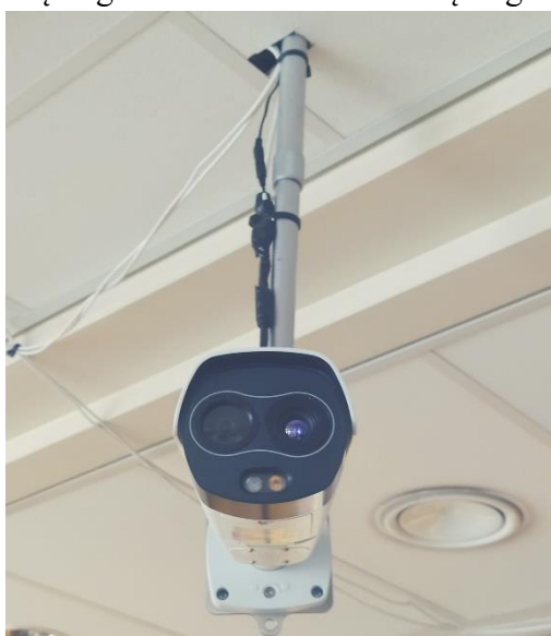
BEKONTAKTĖ TERMORIZINĖ KAMERA

Tuo tikslu įrengtos/atnaujintos izoliavimo patalpos su atskirais įėjimais iš lauko, esamos patalpos ir laukiamųjų zonos maksimaliai pritaikytos saugiai dirbti su įvairių grupių pacientais, suskirstyti ir suvaldyti pacientų ir darbuotojų srautai, prie įėjimų į polikliniką įrengti „pacientų filtrai“, prie pagrindinių įėjimų įrengti termovizorius bei temperatūros matuokliai. Prie įėjimų ir įstaigos patalpose įrengti dezinfekciniai stovai. Įrengta nauja infekuotų atliekų patalpa.